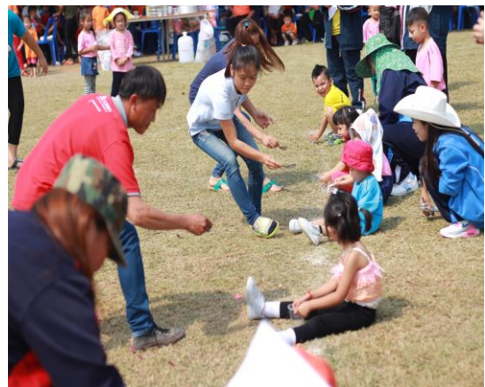
รูปภาพ : กิจกรรมกีฬาศูนย์พัฒนาเด็กเล็ก