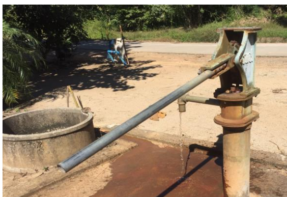
รูปภาพ : บ่อบาดาล หมู่ที่ 1 บริเวณหน้าวัดมรรคคาราม