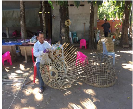
รูป : กิจกรรมสมาชิกกลุ่มจักรสานผู้สูงอายุ หมู่ 1 บ้านสันถนนเหนือ