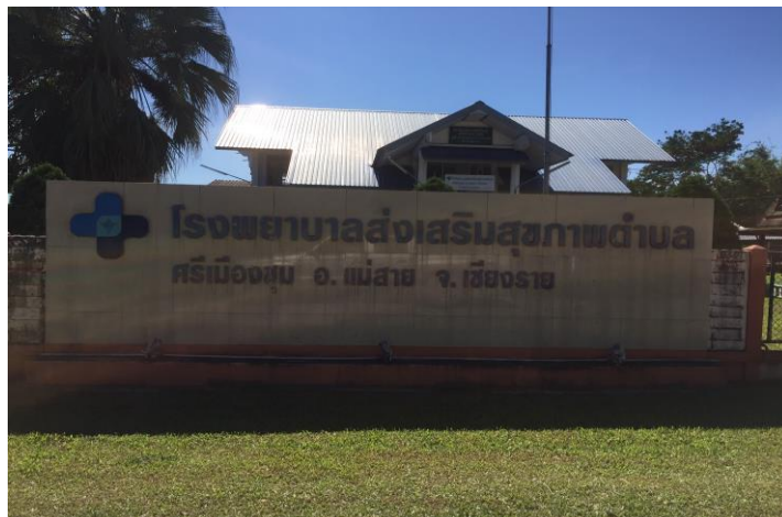
รูปภาพ : โรงพยาบาลส่งเสริมสุขภาพตำบล

ในเขตพื้นที่องค์การบริหารส่วนตำบลศรีเมืองชุม มีโรงพยาบาลส่งเสริมสุขภาพตำบล จำนวน 1 แห่ง ได้แก่ โรงพยาบาลส่งเสริมสุขภาพตำบลศรีเมืองชุม ตั้งอยู่หมู่ที่ 8 บ้านสันถนนใต้ ตำบลศรีเมืองชุม อำเภอแม่สาย จังหวัดเชียงราย มีบุคลากรทางการแพทย์ (เจ้าพนักงานสาธารณสุข) จำนวน 5 คน, อาสาสมัครสาธารณสุข จำนวน 163 คน และศูนย์สาธารณสุขมูลฐานประจำหมู่บ้าน 9 แห่ง