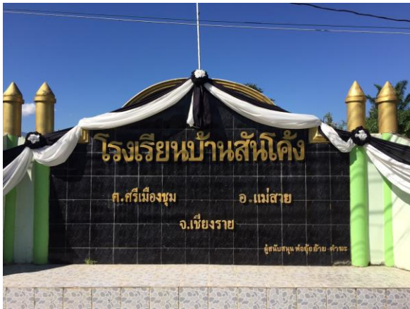
รูปภาพ (ซ้าย) : โรงเรียนบ้านสันโค้ง