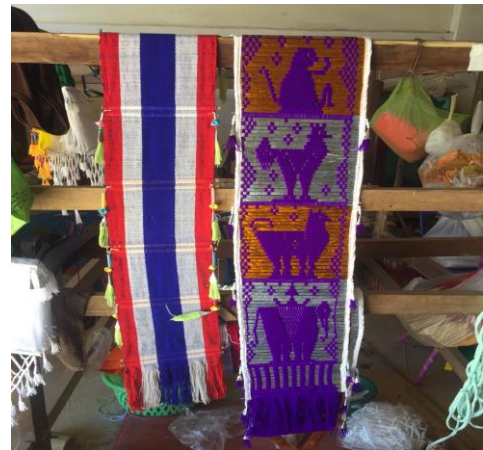
รูป : กิจกรรมสมาชิกวิสาหกิจชุมชนกลุ่มทอผ้าบ้านสันถนนใต้ หมู่ที่ 2