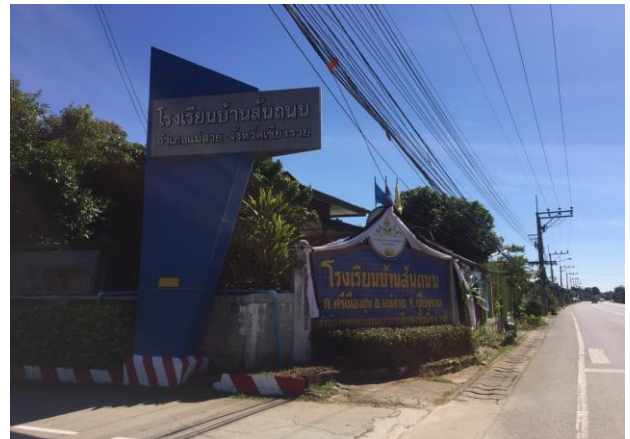
รูปภาพ (ขวา) : โรงเรียนบ้านสันถนน