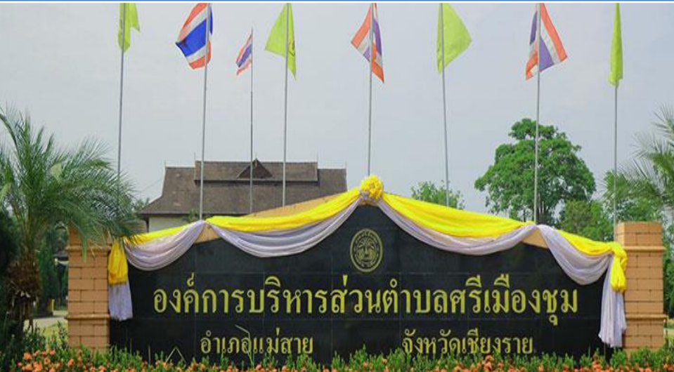
องค์การบริหารส่วนตำบลศรีเมืองชุม อำเภอแม่สาย จังหวัดเชียงราย