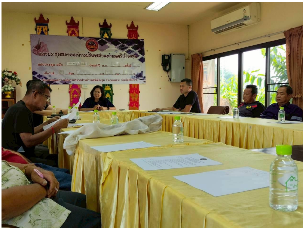
ภาพการประชุมหารือการเตรียมการจัดงานโครงการแข่งขันกีฬาพื้นบ้านสานสัมพันธ์ผู้สูงอายุตำบลศรีเมืองชุม ประจำปีงบประมาณ พ.ศ. ๒๕๖๙