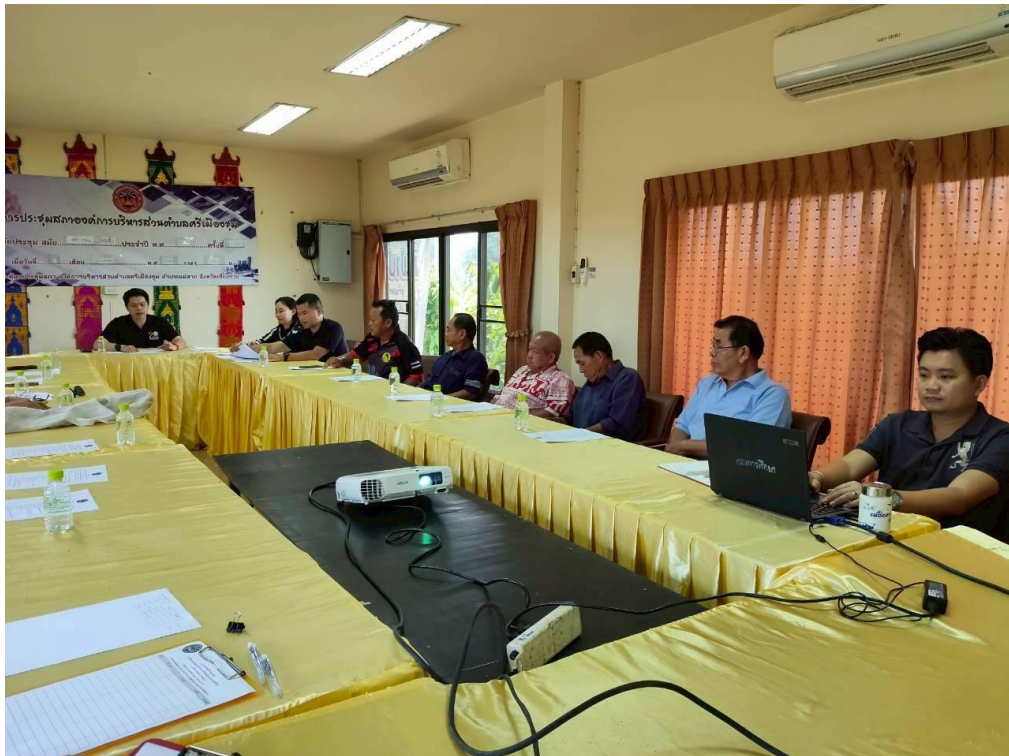
ภาพการประชุมหรือการเตรียมการจัดงานโครงการแข่งขันกีฬาพื้นบ้านสานสัมพันธ์ผู้สูงอายุตำบลศรีเมืองชุม ประจำปีงบประมาณ พ.ศ. ๒๕๖๘