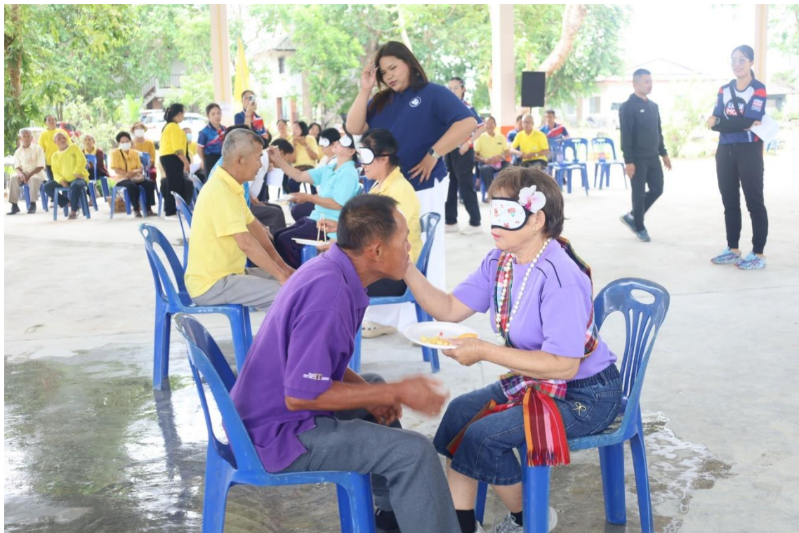
การแข่งขันกีฬาพื้นบ้านสานสัมพันธ์ผู้สูงอายุตำบลศรีเมืองชุม วันที่ ๒๙ เมษายน ๒๕๖๙ ประจำปีงบประมาณ พ.ศ. ๒๕๖๙