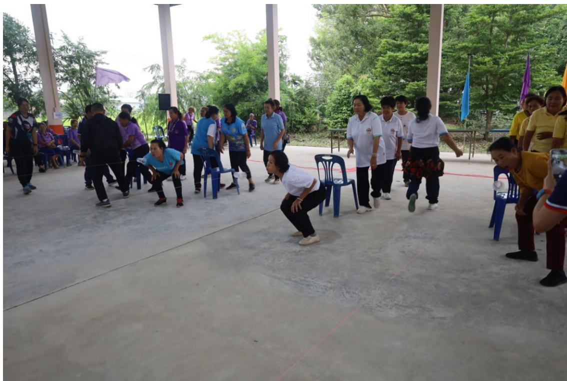
การแข่งขันกีฬาพื้นบ้านสานสัมพันธ์ผู้สูงอายุตำบลศรีเมืองชุม วันที่ ๒๙ เมษายน ๒๕๖๙ ประจำปีงบประมาณ พ.ศ. ๒๕๖๙