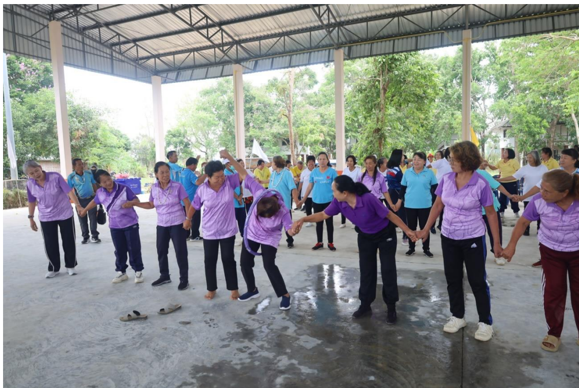
การแข่งขันกีฬาพื้นบ้านสานสัมพันธ์ผู้สูงอายุตำบลศรีเมืองชุม วันที่ ๒๙ เมษายน ๒๕๖๙ ประจำปีงบประมาณ พ.ศ. ๒๕๖๙