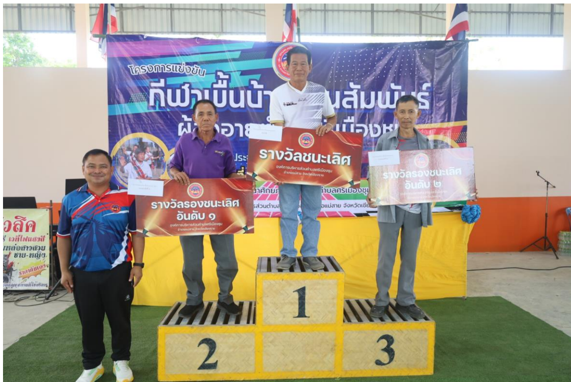
การแข่งขันกีฬาพื้นบ้านสานสัมพันธ์ผู้สูงอายุตำบลศรีเมืองชุม วันที่ ๒๙ เมษายน ๒๕๖๙ ประจำปีงบประมาณ พ.ศ. ๒๕๖๙