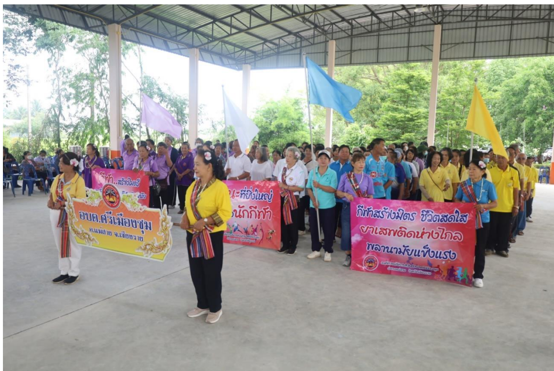
การแข่งขันกีฬาพื้นบ้านสานสัมพันธ์ผู้สูงอายุตำบลศรีเมืองชุม วันที่ ๒๙ เมษายน ๒๕๖๙ ประจำปีงบประมาณ พ.ศ. ๒๕๖๙