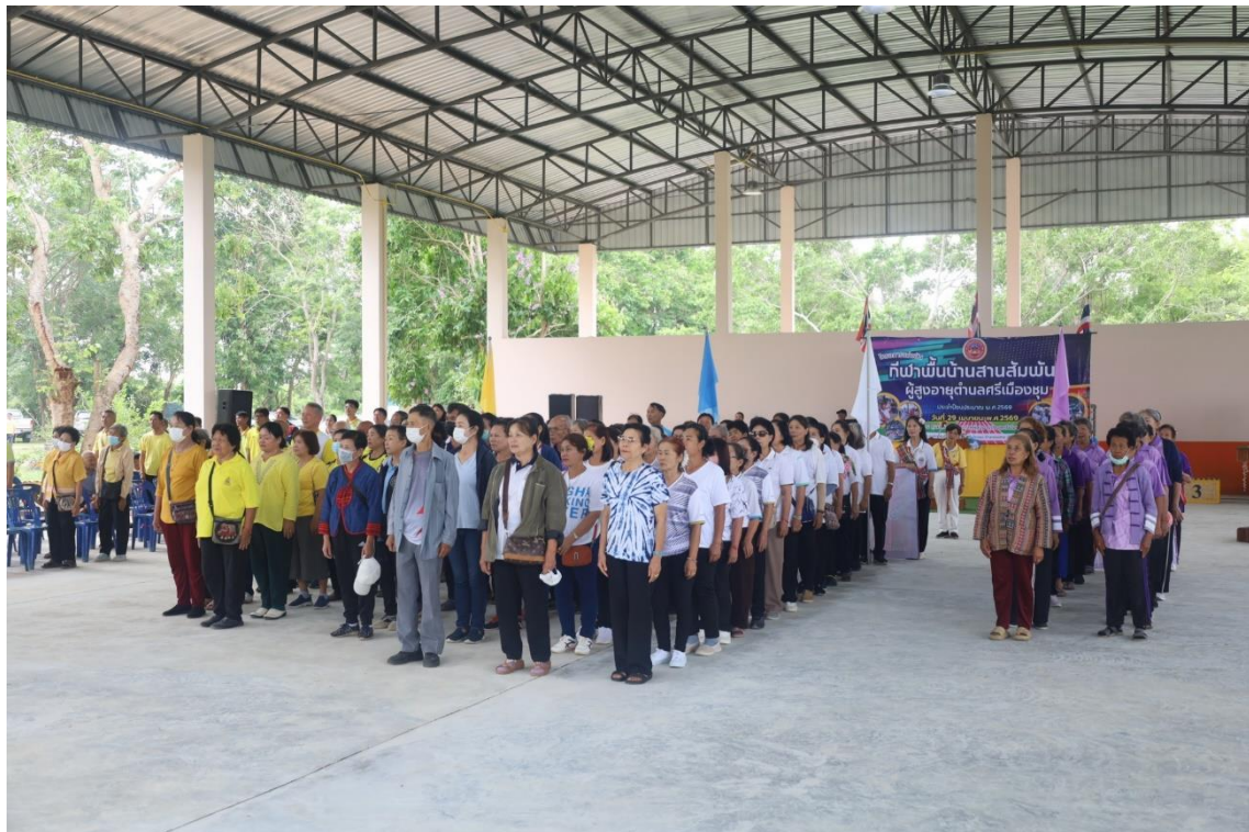
การแข่งขันกีฬาพื้นบ้านสามสัมพันธ์ผู้สูงอายุตำบลศรีเมืองชุม วันที่ ๒๙ เมษายน ๒๕๖๙ ประจำปีงบประมาณ พ.ศ. ๒๕๖๙