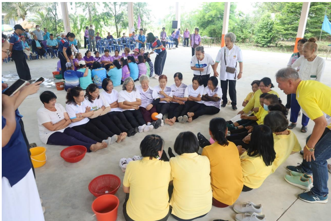
การแข่งขันกีฬาพื้นบ้านสานสัมพันธ์ผู้สูงอายุตำบลศรีเมืองชุม วันที่ ๒๙ เมษายน ๒๕๖๙ ประจำปีงบประมาณ พ.ศ. ๒๕๖๙