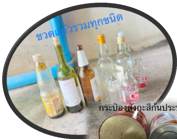
กระป๋องสังกะสีกันประปองเรียบ