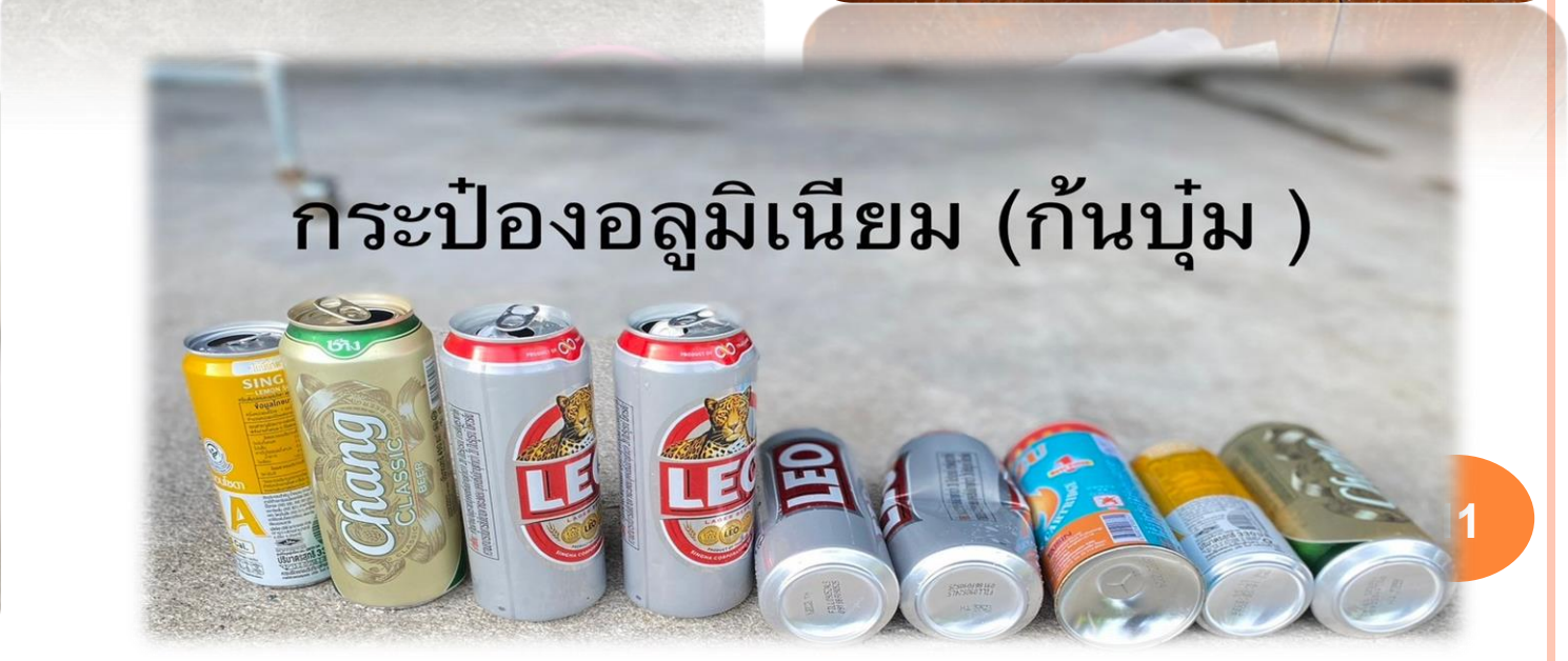
กระป๋องอลูมิเนียม (ก้นบวม)