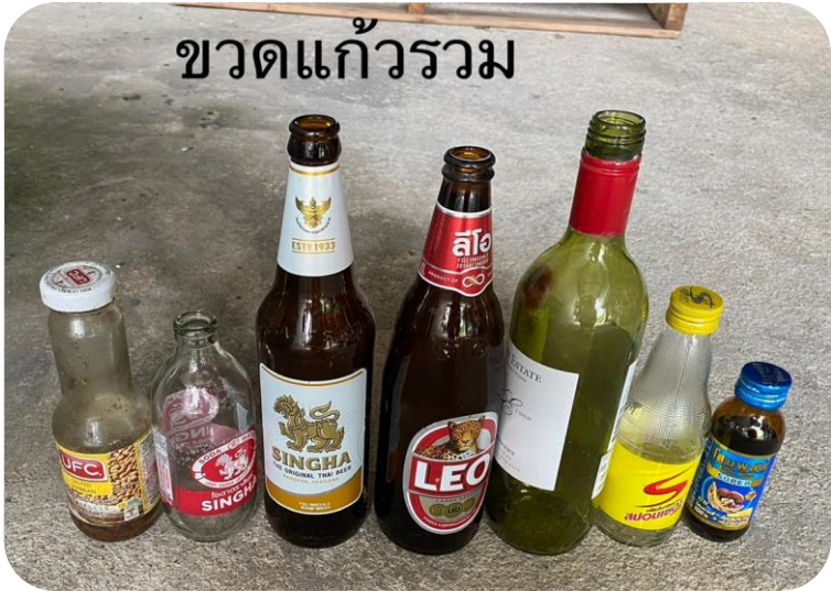
ขวดแก้วรวม