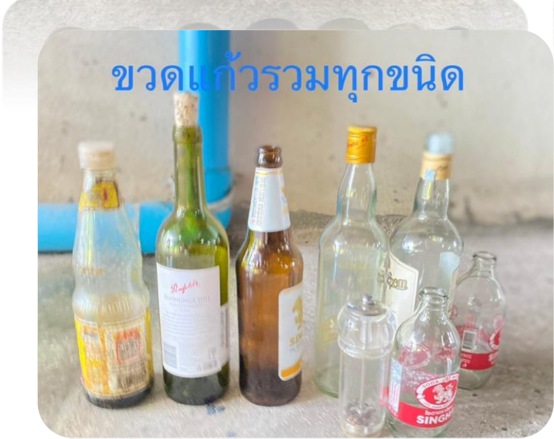
ขวดแก้วรวมทุกชนิด