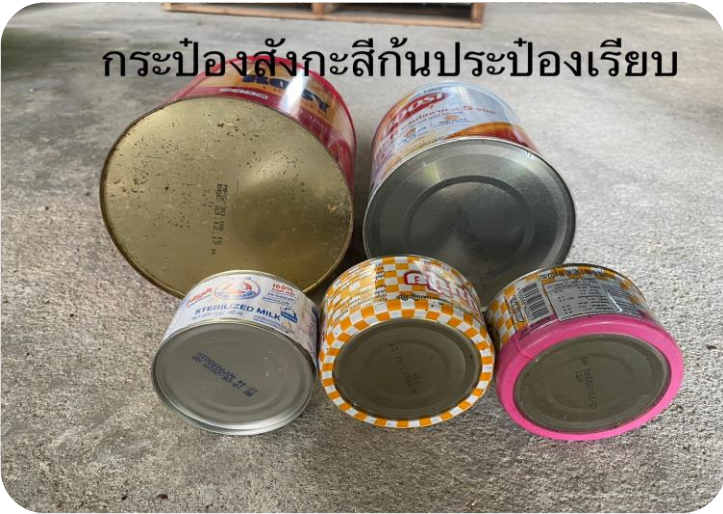
กระป๋องสังกะสีกันประป๋องเรียบ