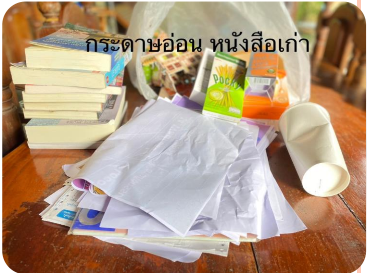
กระดาษอ่อน หนังสือเก่า